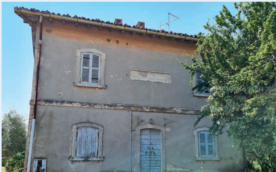
Il casello dell'ex ferrovia Santarcangelo-Urbino di via Celletta dell'Olio

possibile senza il lavoro che ha portato all'acquisizione di alcuni caselli della linea ferroviaria Santarcangelo-Urbino – afferma l'assessore alla Pianificazione urbanistica e al Patrimonio Filippo Sacchetti – mediante il passaggio della proprietà dal demanio statale all'Amministrazione comunale. Si è trattato senz'altro di un'acquisizione strategica, che assume oggi ancor più valore, perché alla funzione sociale coniuga un progetto di riqualificazione e rigenerazione urbana".