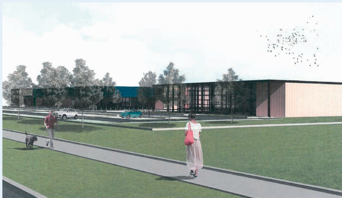
Il rendering dell'intervento previsto nell'area ex Adriaauto

della via Emilia ovest: le opere pubbliche comprendono infatti la cessione di un'area verde di oltre 3.130 metri quadrati a fianco della via Emilia, che ospiterà anche un tratto di 700 metri del percorso ciclabile che sarà completato dai Pua degli ambiti adiacenti e che collegherà la statale a via Andrea Costa. In via Nuvolari, oltre al completamento della fognatura bianca e al rifacimento di quella esistente, è prevista anche la realizzazione di un parcheggio pubblico con oltre 60 posti auto.