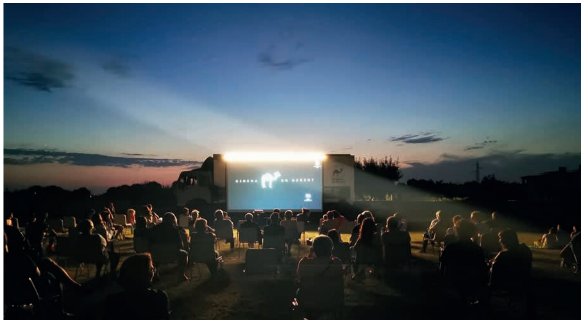
Una proiezione della rassegna Frazioncine

Per maggiori informazioni su tutte le iniziative e per essere aggiornati su eventuali modifiche al programma, è disponibile sul sito del comune una sezione dedicata agli eventi dell'estate ( www.comune.santarcangelo.rn.it/70-serate ).