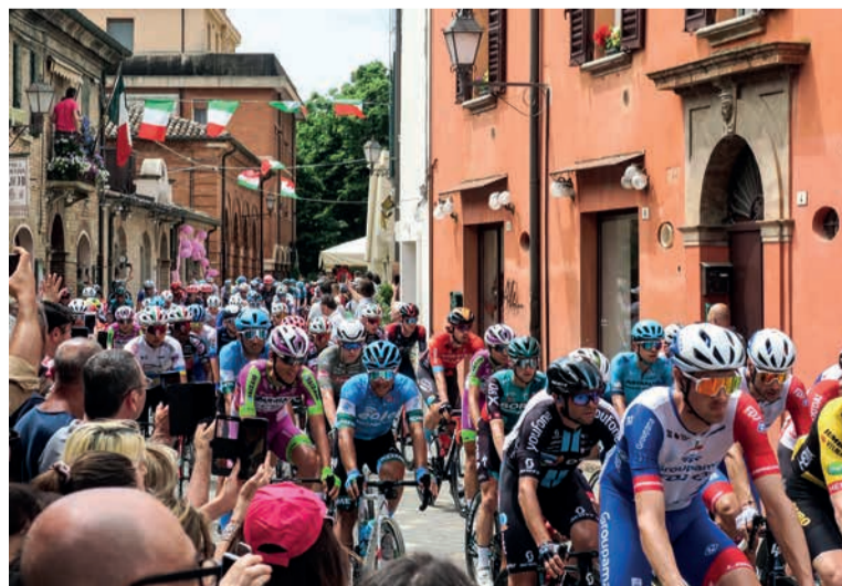
Il passaggio del Giro in via Cesare Battisti

L'Amministrazione comunale ringrazia per il sostegno tutti gli sponsor del Comitato di tappa: le dieci imprese che hanno voluto sostenere le iniziative organizzate dall'Amministrazione comunale sono state protagoniste – insieme ai partner istituzionali e a diverse associazioni del territorio – del "Villaggio in Rosa" allestito alla vigilia della tappa e nel giorno del Giro nelle vie Cavour, Don Minzoni, Matteotti e Molari.