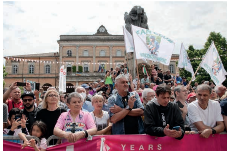
Il pubblico presente in piazza Ganganelli

"Santarcangelo saluta il Giro" lunga 75 metri – tre volte la Torre civica – allestita lungo la via Emilia dall'impresa Agri Ubaldi srl (sponsor tecnico del Comitato di tappa) con 220 balle di paglia.