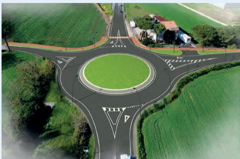
Il rendering della nuova rotatoria che sarà realizzata all'incrocio tra le vie Tosi, Antica Emilia e SP136

Il progetto per la realizzazione della rotatoria all'intersezione tra via Pasquale Tosi, via Antica Emilia e la SP136 "Santarcangelo Mare", al confine tra i Comuni di Santarcangelo e Rimini è stato presentato alla frazione il 20 aprile scorso.